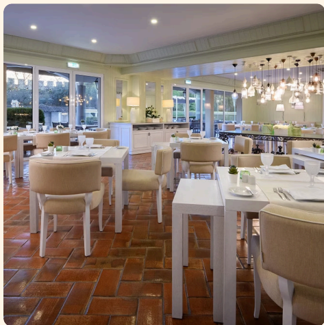
Restaurante Sabores do Alentejo

A gastronomia alentejana é uma das mais ricas e autênticas de Portugal. No M'AR de AR Muralhas , cada refeição é uma viagem pelos sabores da região – dos enchidos artesanais aos queijos curados, das açordas tradicionais aos doces conventuais.