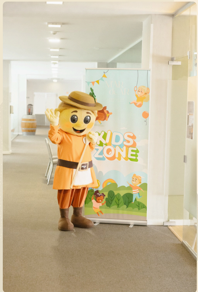
Clubinho com a mascote Migas