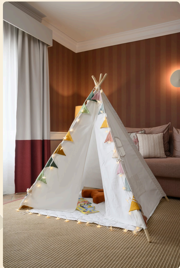
Quartos de família