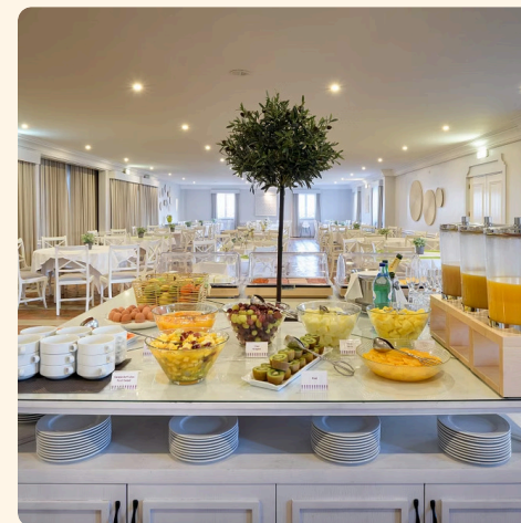
Pequeno - Almoço