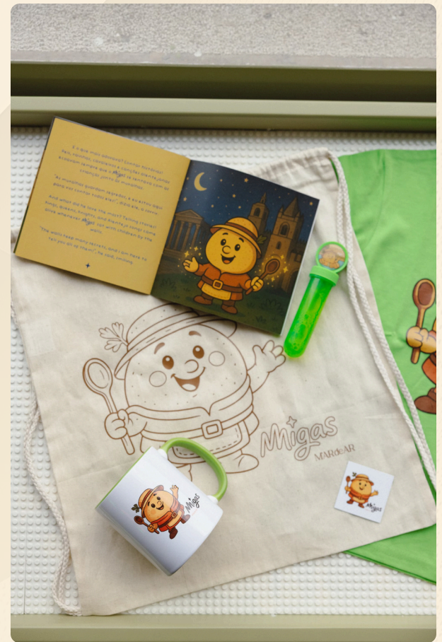
Amenities & Merchandising